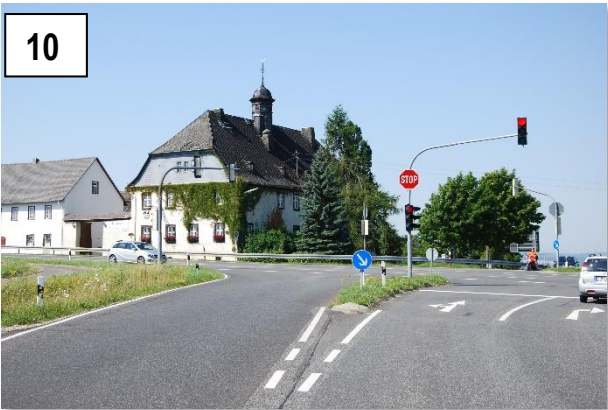
Hühnerkirche vor Limbach