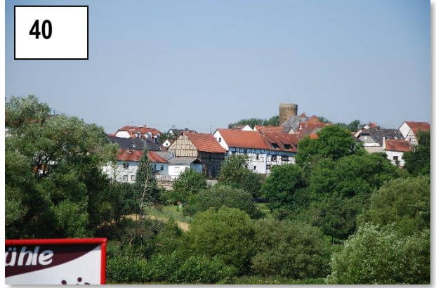
Blick auf Walsdorf