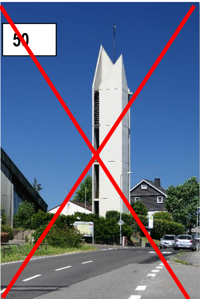
Kirchturm in Kemel (Negativkontrolle)