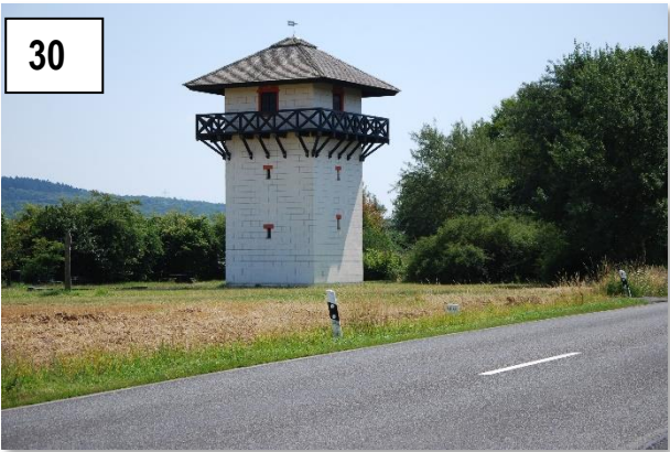
Römerturm hinter Lenzhahn