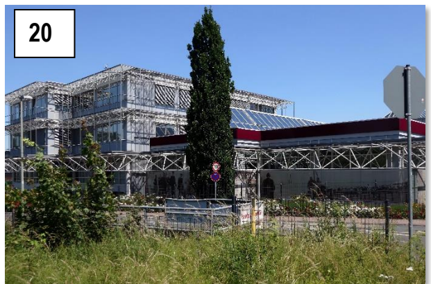
Central Garage, Bad Homburg