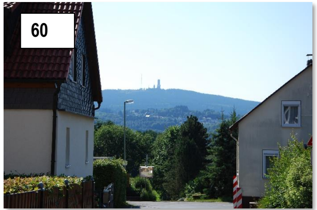
Seelenberg, Blick auf den Feldberg